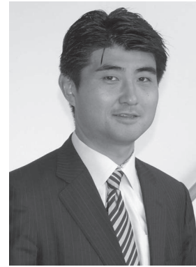
（株）東京大学エッジキャピタル（UTECH）代表取締役社長

2004年 東京大学エッジキャピタル（UTECH）創業に参画。以来、ユーテック一号投資事業有限責任組合（約83億円、2004年～）、UTECH2号投資事業有限責任組合（約76.5億円、2009年～）の設立を担当するとともに、ベンチャー企業の創業早期の段階からのベンチャーキャピタル活動を手がけてきた。これまでに支援を行ってきた投資先は、テラ（株）（2009年3月JASDAQ上場）、（株）モルフォ（2011年6月東証マザーズ上場承認）、（株）シリウステクノロジー（2010年8月ヤフー（株）により買収）、アドバンスト・ソフトマテリアルズ（株）、（株）ウッドプラスチックテクノロジー、popIn（株）、（株）サイアン等。